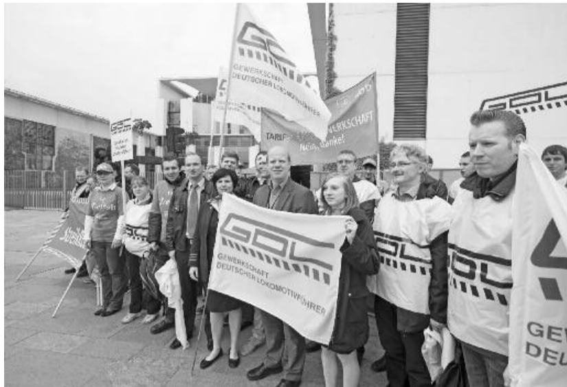
1. Mai 2014

Im Verhandlungsprotokoll zwischen Agv MoVe und GDL, das am