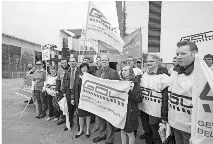
1. Mai 2014

Im Verhandlungsprotokoll zwischen Agv MoVe und GDL, das am